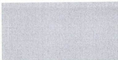
Vinarija Pantić, Mladenovac